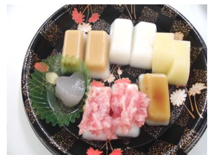
ソフト食のお寿司