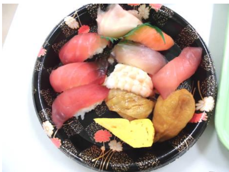
こんな感じで握っていただきました。