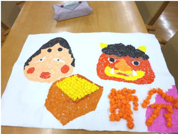
節分の作品を作りました。