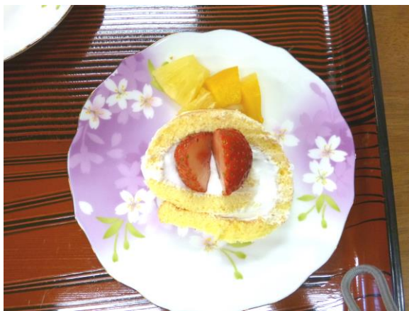
お皿に盛りつけられたケーキ