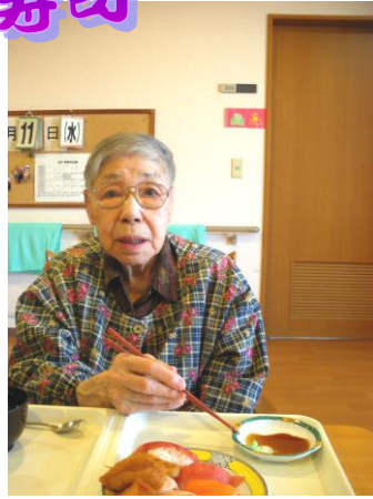
やっぱり「お寿司よね♪」