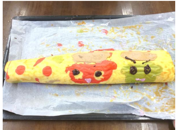
鬼を描いたケーキ