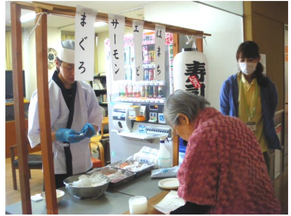
寿司バイキングは大好評