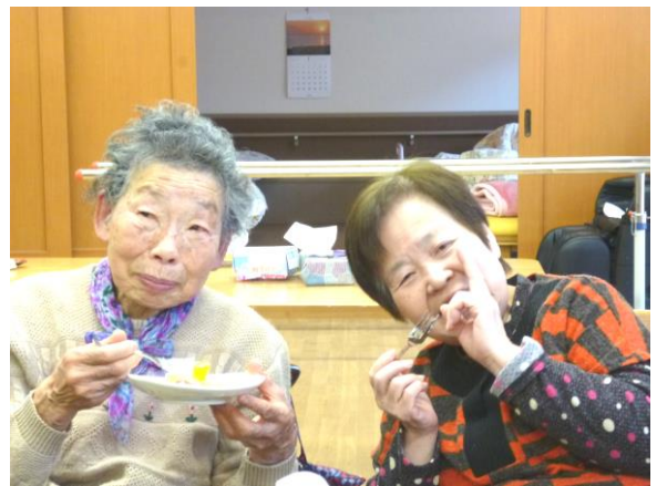
甘くておいしかったと大好評でした。