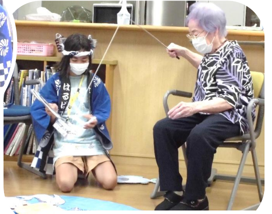
魚釣り 大物を狙いゲット!