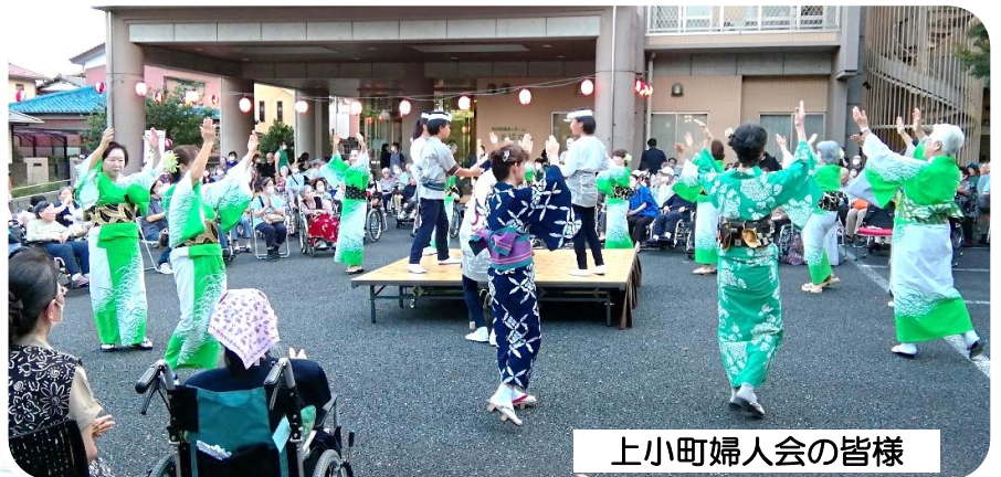
上小町婦人会の皆様

本格的な和太鼓を叩かせて頂きました。皆様とても上手に迫力ある大きな音が響きました！