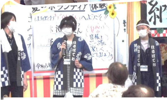
学生ボランティアさん上手に自己紹介

社会福祉協議会様主催「夏のボランティア体験」が4年ぶりに対面での開催となり、小学生から社会人まで多くの方が参加して下さいました。ありがとうございました。