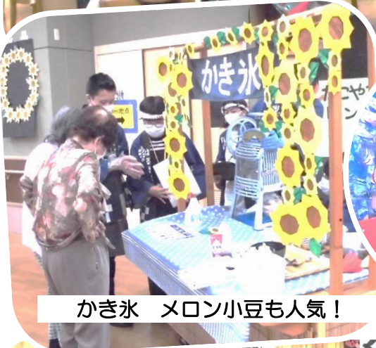
かき氷 メロン小豆も人気!