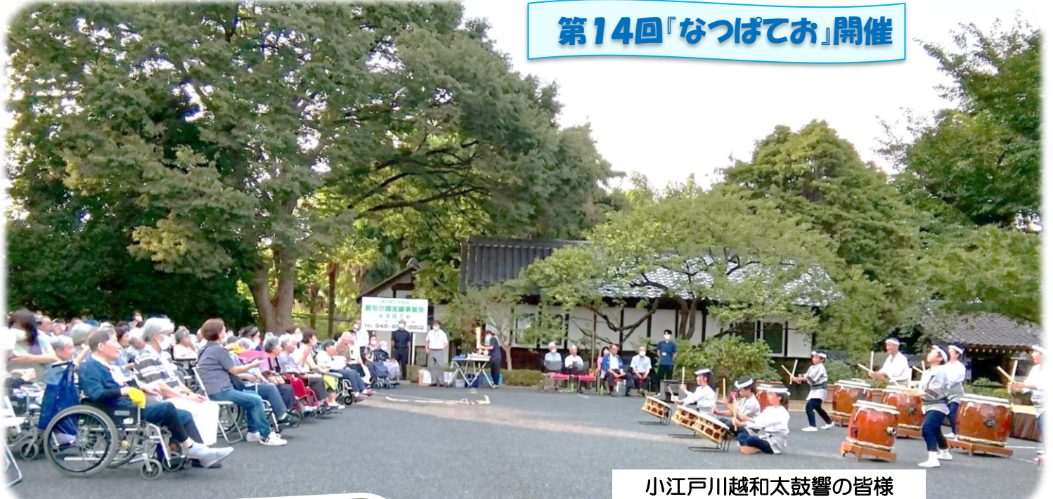
小江戸川越和太鼓響の皆様

実に4年の歳月を経て、夏祭りが復活致しました！響の皆さまによる大迫力の素晴らしい和太鼓演奏で幕を開け、そして上小町婦人会の方々の優美な盆踊りで、お祭りの雰囲気最高潮になりました。残暑の中、ご協力いただきました全ての皆様に感謝申し上げます。