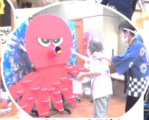
大タコの口を目掛けて