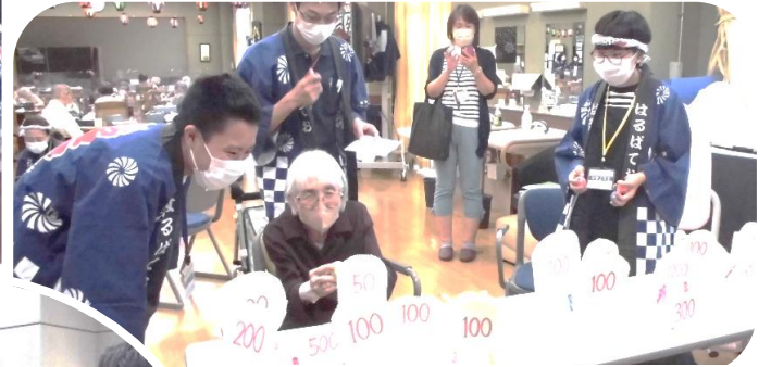
的当て 高得点を狙いました!