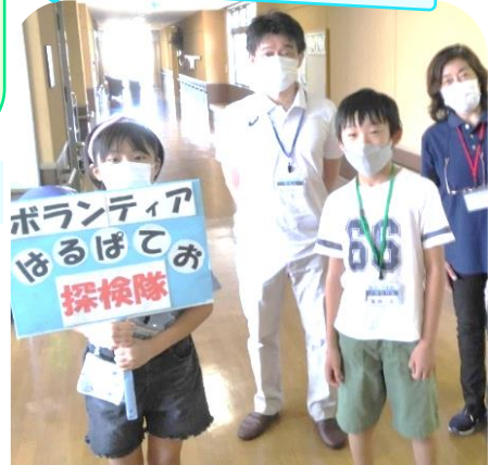
はるばてお探検しました!