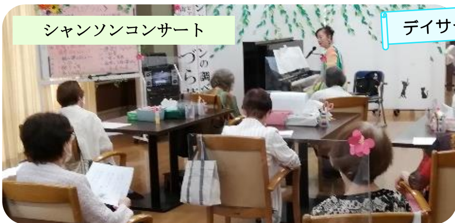
デイサービス&ショートステイ