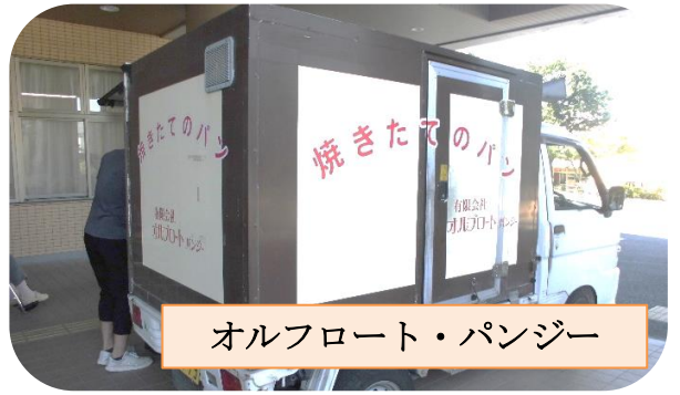
オルフロート・パンジー

皆様お待ちかねの移動パン屋『オルフロートパンジー』さんが毎週月曜日の13:30頃に来てくれることになりました！とても懐かしくて、あれもこれも欲しくなっています。ボランティアさんもお手伝いしてくれました。