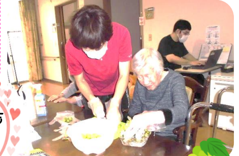
ブドウを房から取るのを一緒に！美味しそう

はるばておの皆様ボランティアさまからいただいた心温まる優しいメッセージをご紹介します。