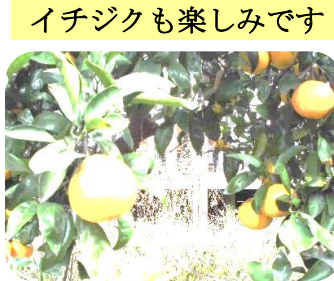
イチジクも楽しみです