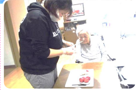
姫リンゴをウサギにしましょうか