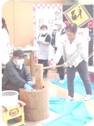
つき立てのお餅を 美味しくいただきました