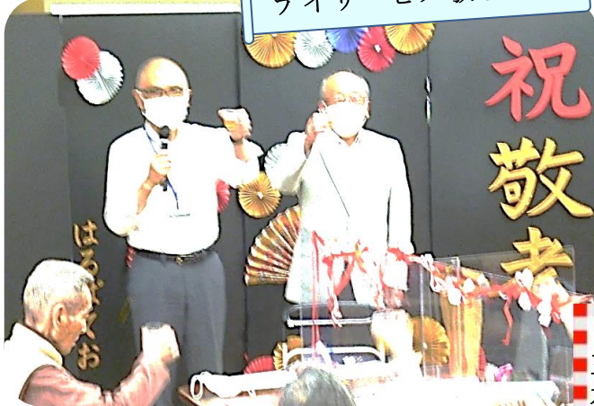
理事長並びに常務による祝辞、そして皆様に乾杯をいたしました！