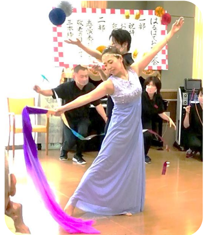
職員による華麗な『お祝いのダンス』が披露されました