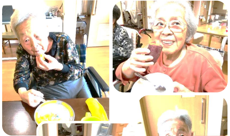
美味しい 笑顔が あふれました

今年もはるぱておの窯で美味しいお芋が焼けました！焼きたてのお芋を、お部屋で召し上がっていただきました。シルクスイートは絹のように滑らかな食感で、とても甘くて、皆様に喜んでいただけました。