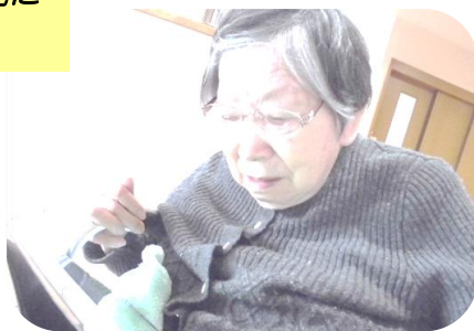
季節の花を職員と 一緒に作りました