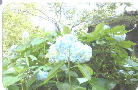
紫陽花の季節になりました