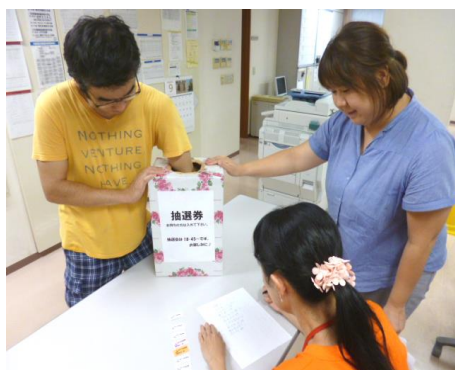
抽選を行っている様子