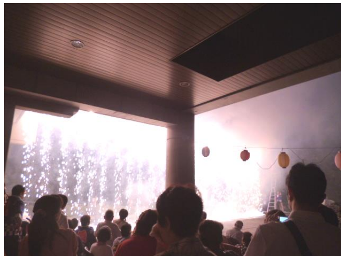
雨の中、ナイアガラの花火を行うことが出来ました。今回もとてもきれいでした。