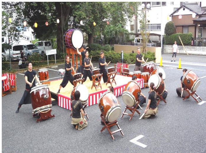
和太鼓「響」による演奏

たくさんの方々のご協力により、今年も無事夏祭りを行うことができました。大勢の皆様に参加をいただき大盛況でした。今年、南京玉簾・太鼓・マジックショー・盆踊り・職員によるソーラン節などイベントが盛りだくさんでした。ご協力して頂いたご家族様・ボランティアさん・地域の皆様・並びにご関係者様本当にありがとうございました。