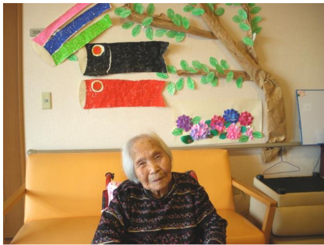
こいのぼりを作り特養ユニットに飾りました