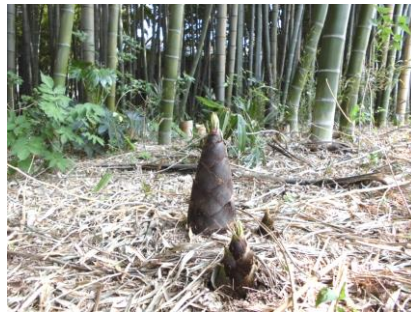
ヒョッコリ顔を出したタケノコ