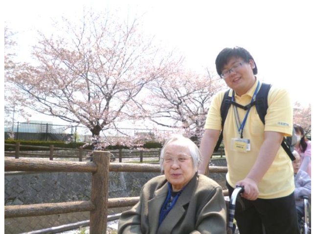
デイのご利用者様が外出し花見を楽しみました